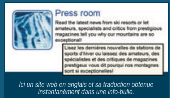
Ici un site web en anglais et sa traduction obtenue instantanément dans une info-bulle.